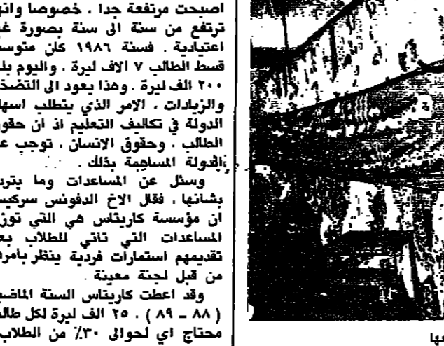
الاضحية قبل توزيعها

انتهت الهيئة الاسلامية للرعاية وبالتنسيق مع هيئة الاعمال الخيرية مكتب صيدا - عمليات ذبح وتوزيع الاضحية التي بلغت ٦١٩٠ حصة كانت الهبات والجمعيات التالفة قد قدمت لها خدعة من الهيئة المباركة وهي على الشكل التالي: